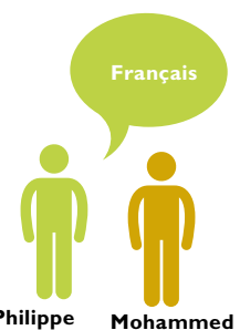
Table de conversation française

juillet. Merci de renouveler votre intérêt en tant qu'offreur ou demandeur pour ce savoir.