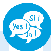
Table de conversation française