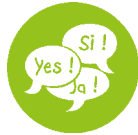
Table de conversation française

Pendant l'été, des échanges s'arrêtent d'autres continuent. Des participants partent en vacances, d'autres reviennent ou rejoignent le réseau. C'est pourquoi nous vous proposons une réunion le lundi 8 juillet à 14.00 avec tous les personnes qui veulent partager leurs savoirs en français et celles et ceux qui désirent pratiquer, découvrir et vivre la langue française. Nous définirons nos offres et demandes et organiserons les différents groupes pour les deux mois d'été. Au plaisir de vous retrouver nombreux !