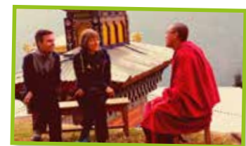
Table de conversation anglaise